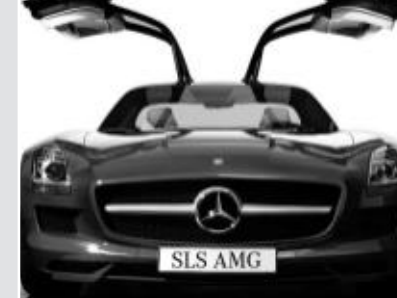
▲ Portes papillon