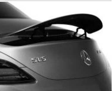
Défecteur arrière rétractable ▲