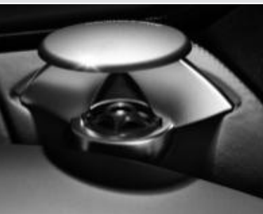
Système de sonorisation ▲ Bang & Olufsen BeoSound AMG