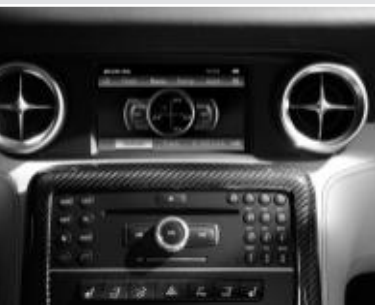
AMG Performance Media ▲