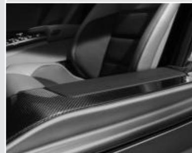
Baguettes de seuil en carbone ▼ (Pack Carbone Intérieur AMG)

* Offres de Location Longue Durée sur 36 mois, moyennant un premier loyer de 20% du prix client TTC (options comprises)