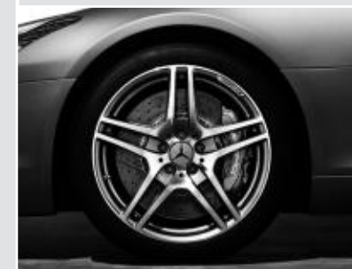
▲ Jantes alliage AMG 48 cm (19") / 51 cm (20")