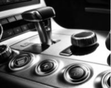
DRIVE UNIT AMG ▲