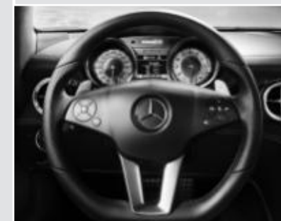
▼ Volant Performance AMG en cuir