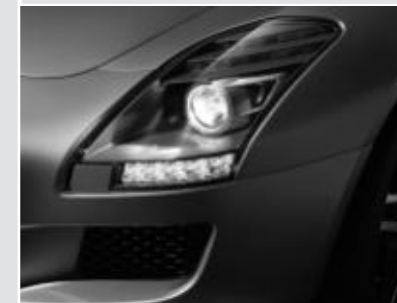
▲ Projecteurs bi-xénon