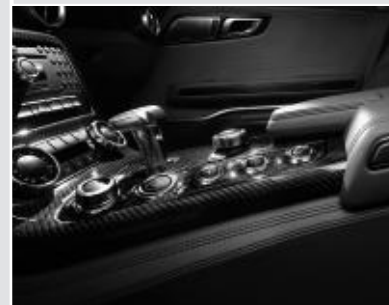
▲ Inserts en carbone AMG