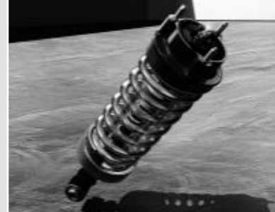
▲ Train de roulement Performance AMG**