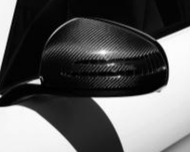
Coques de rétroviseurs en carbone ▲