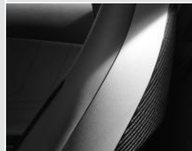
▲ Dossiers des sièges en carbone (Pack Carbone Intérieur AMG)