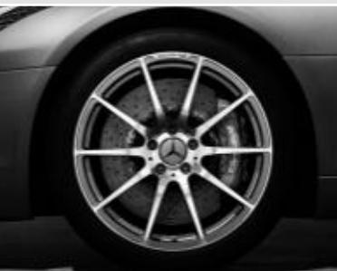
Jantes alliage AMG 10 branches ▲ 48 cm (19") / 51 cm (20") (code 766)