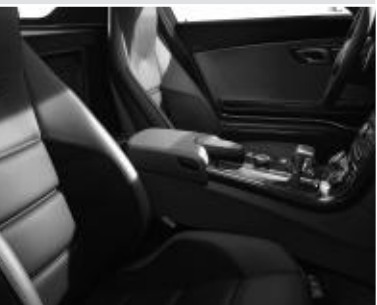
Sièges sport AMG ▲