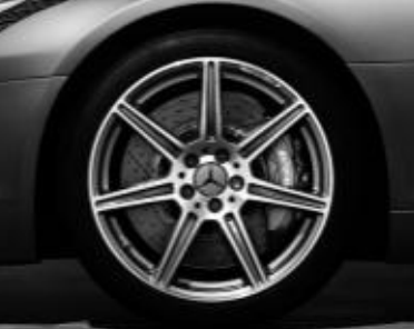
Jantes alliage AMG 7 branches ▲ 48 cm (19") / 51 cm (20") (code 765)