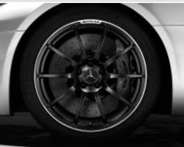
Jantes alliage AMG 10 branches ▲ 48 cm (19") / 51 cm (20") (code 767)