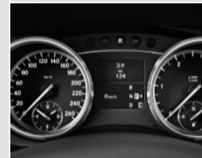
▼ Combiné d'instruments avec graduations 3D