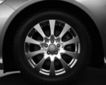
Jantes alliage 46 cm (18") ▲ design 10 branches