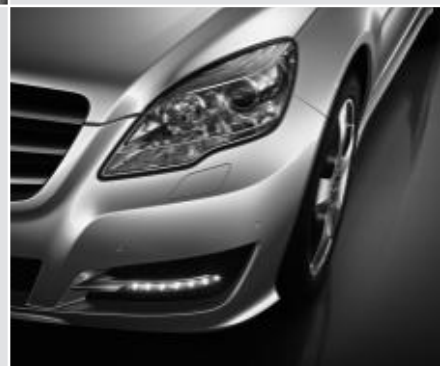
▲ Projecteurs bi-xénon