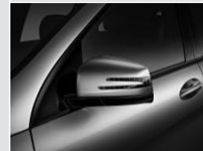
▲ Rétroviseurs électriques chauffants et asphériques avec rappels de clignotant intégrés