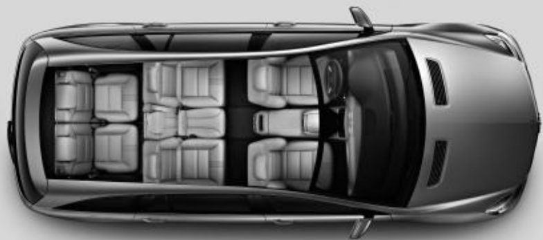
▲ Concept 7 places sur 3 rangées