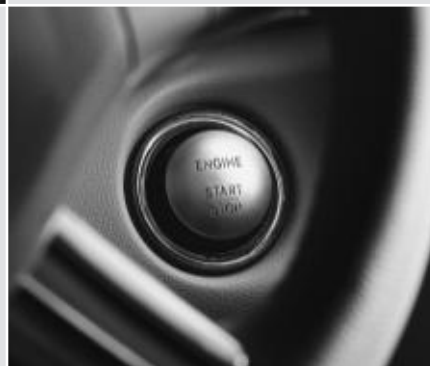
▲ KEYLESS-GO : démarrage sans clé