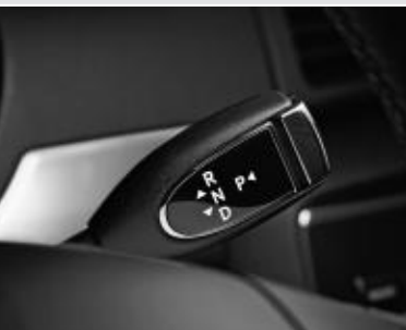
Levier sélecteur DIRECT SELECT et ▲ palettes de commande de boîte au volant