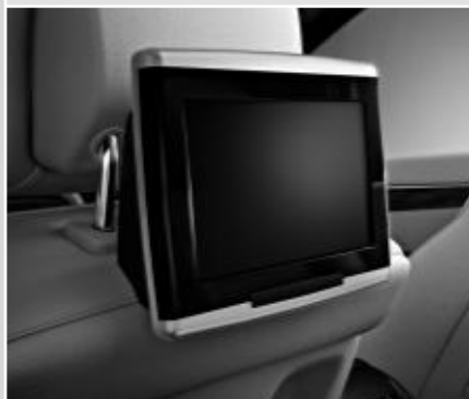
▲ Système de divertissement arrière