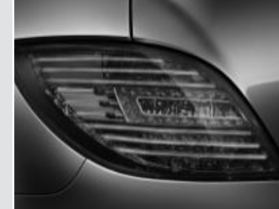
▲ Feux arrière à technologie LED et fibre optique