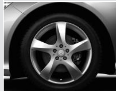
▲ Jantes alliage 48 cm (19") design 5 branches