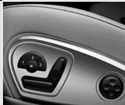
▼ Pack Mémoires