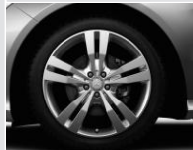
▲ Jantes alliage 51 cm (20") design 5 doubles branches