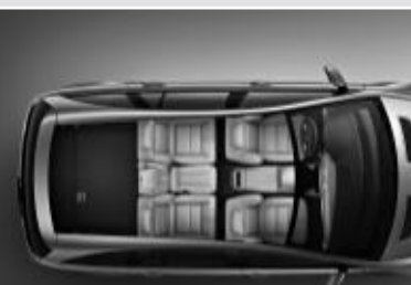
Concept 5 places ▼