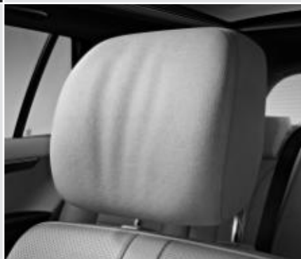
▼ Appuie-tête confort