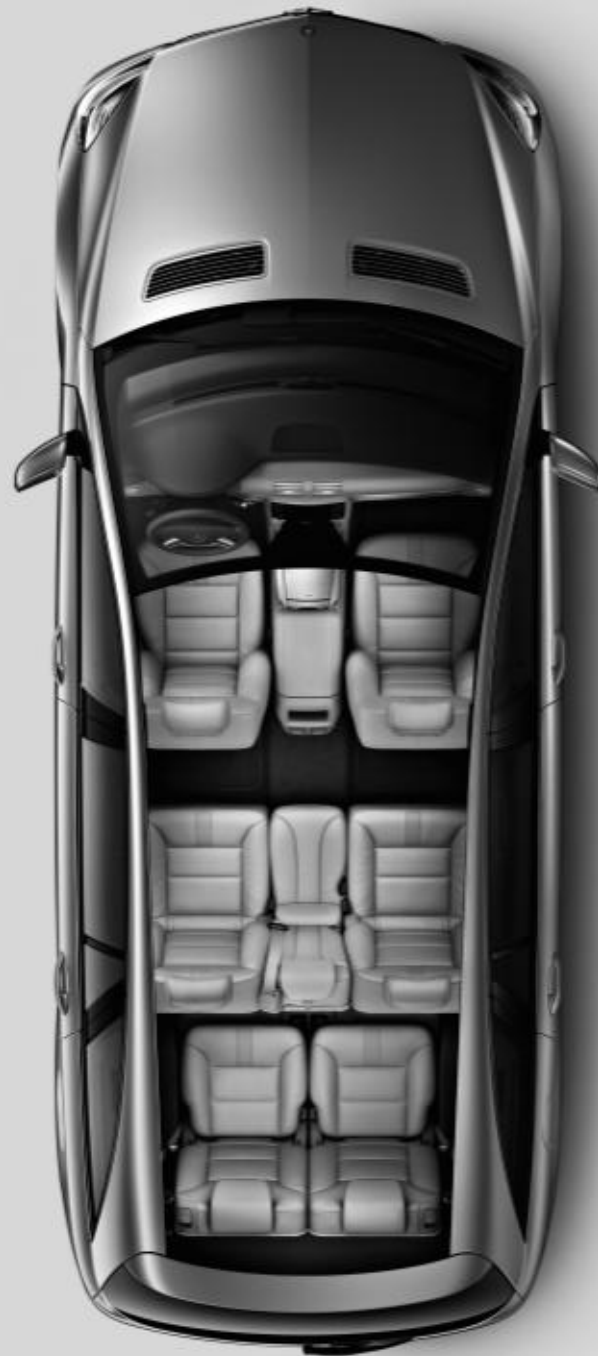
▶ Classe R avec concept 7 places sur 3 rangées.