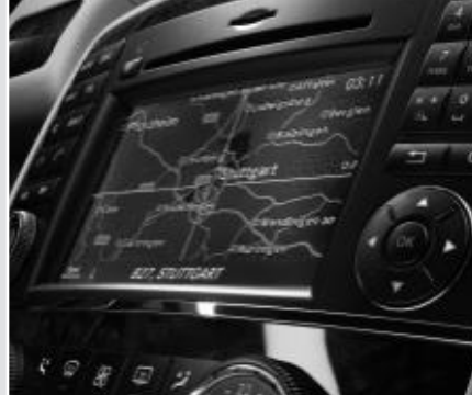
▲ Navigation COMAND APS