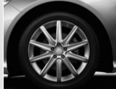
▲ Jantes alliage 48 cm (19") design 10 branches