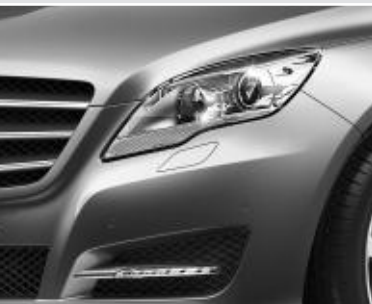
Feux de jour à technologie LED ▲