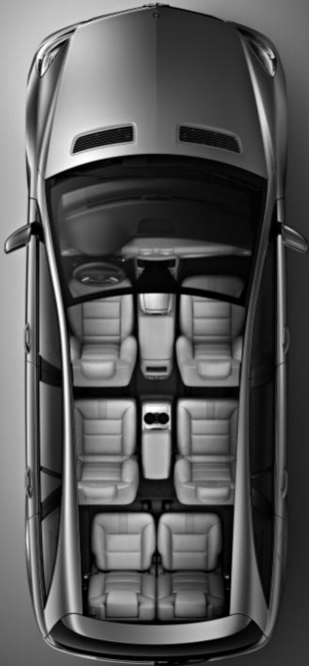
◀ Classe R avec concept 6 sièges individuels sur 3 rangées et console centrale extractible.