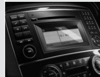
▲ Radio Audio 20 CD avec changeur 6 CD